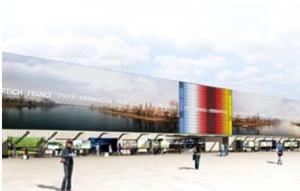
Deutsch-französischer Gemeinschaftspavillon www.expo2005-deutschland.de

Forschungszentrum Karlsruhe GmbH in der Helmholtz-Gemeinschaft