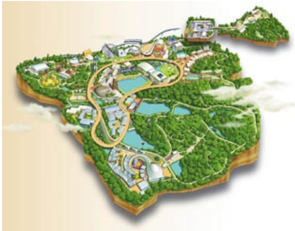
Das Gelände der Weltausstellung EXPO 2005 im Überblick www.expo2005.or.jp

Forschungszentrum Karlsruhe in der Helmholtz-Gemeinschaft